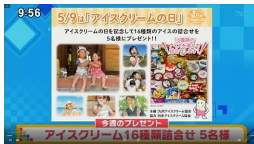
九州(ももち浜ストア)