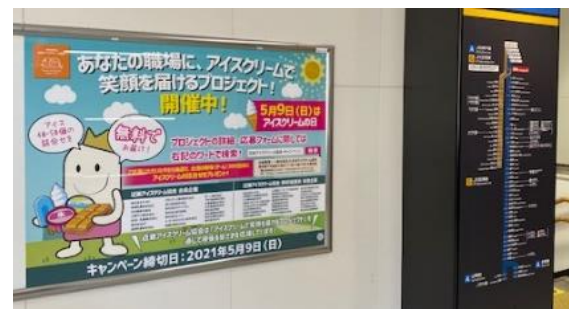
ポスター掲示(上:大阪駅、下:尼崎駅)