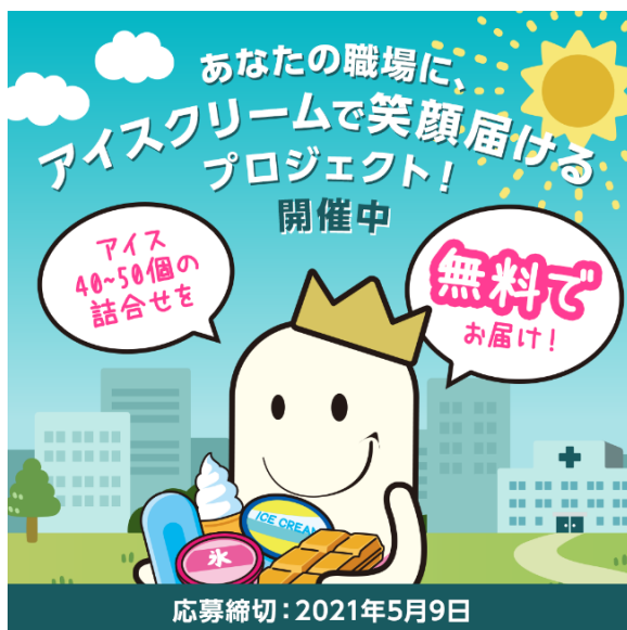
本部作成のプロジェクトデザイン

また、近畿アイスクリーム協会では独自に、ポスターを作成して、①JR西日本の神戸線・京都線17駅でのポスター掲示、②梅田駅、難波駅でのデジタルサイネージュで広報活動を展開して本部企画をバックアップしてもらった。