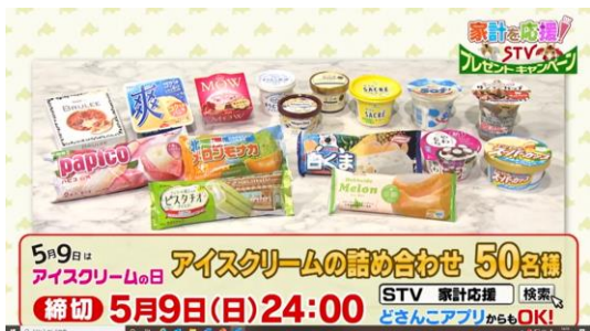
北海道(家計応援キャンペーン)